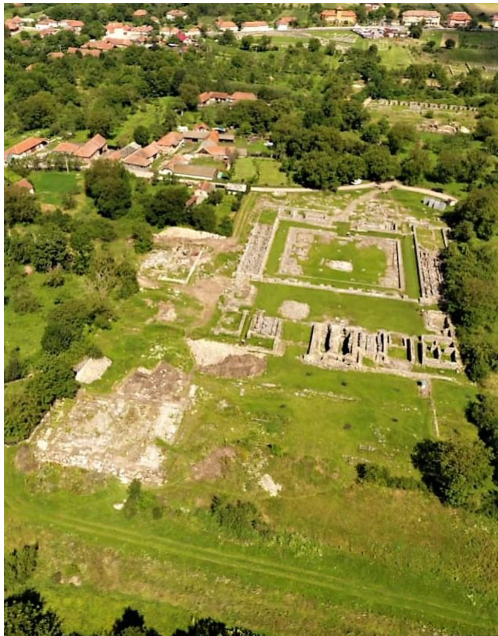
Fig. 1. Forum Novum (Piso, CCA. Campania 2016, 2017 , p. 5).