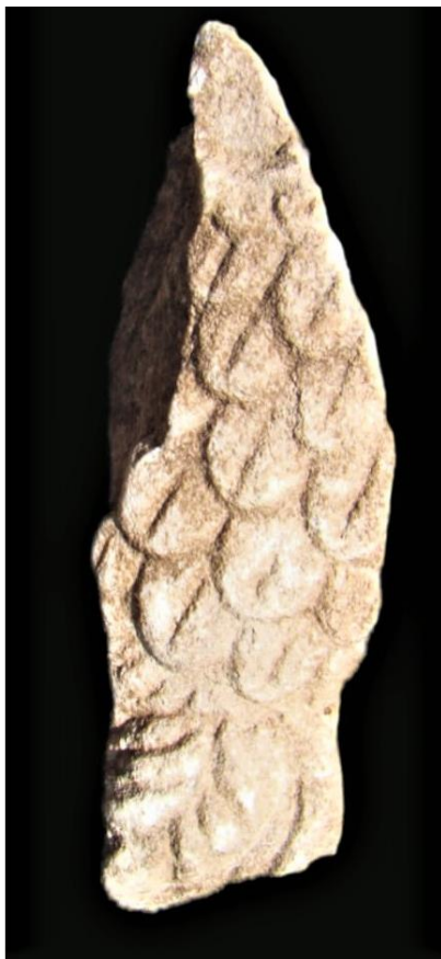
Fig. 4. Fragment de penaj (după Piso, Das Kapitool Von Sarmizegetusa , Abb.1, p.124).